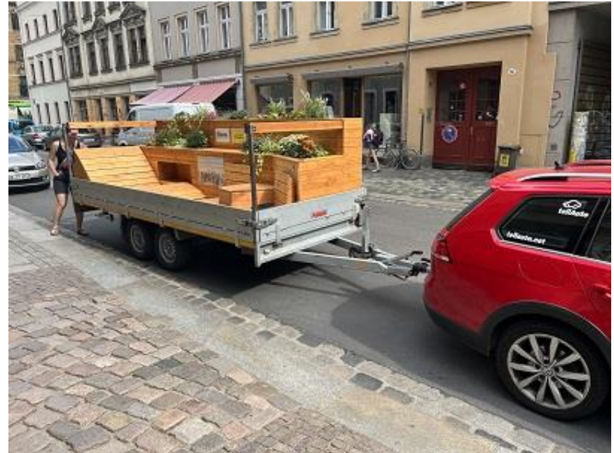
Mobiles Parklet, auch ausleihbar

Bund für Umwelt und Naturschutz Deutschland