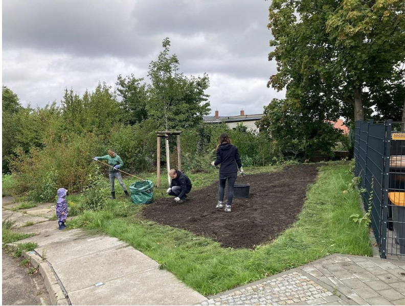
Eine Blühwiese für Gorbitz